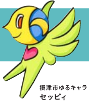
摂津市ゆるキャラ セッピー